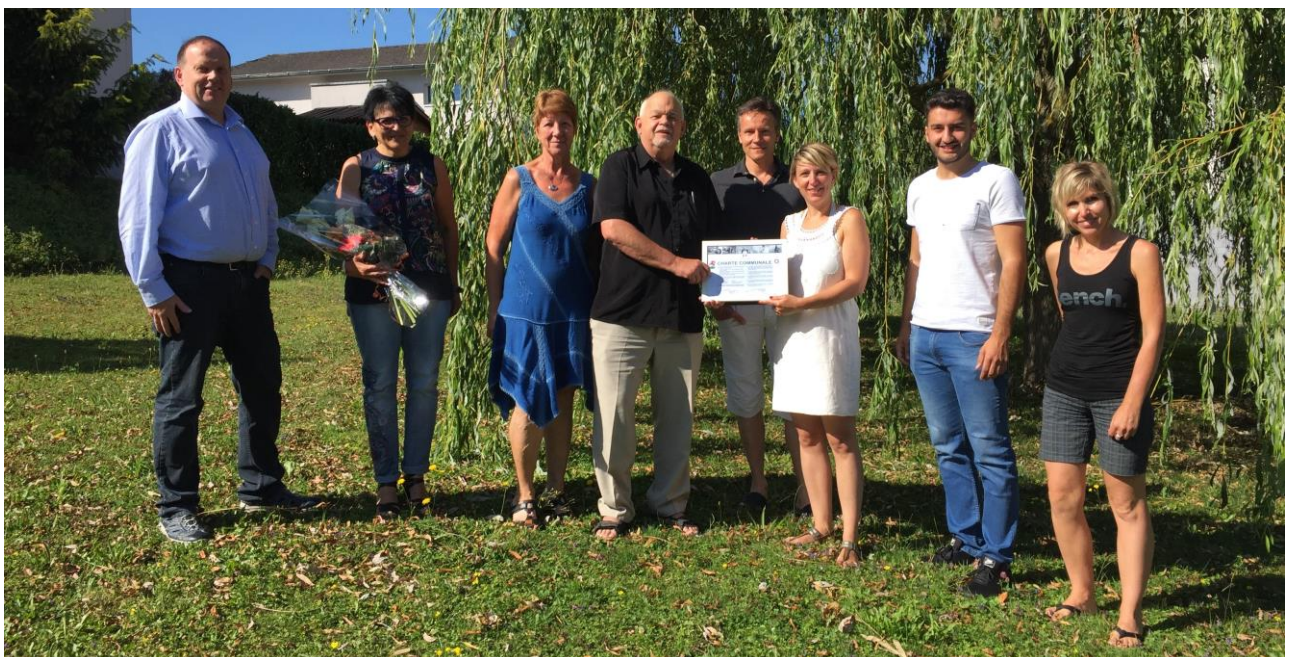
Conseil communal de Rossemaison et Fondation O 2

Sites : www.labelcommunesante.ch et www.fondationo2.ch et www.rossemaison.ch